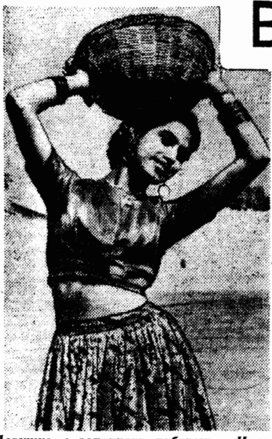
Девушка с западного побережья Индии

Семь лет назад, 26 января 1950 года, в обстановке огромного подъема национально-освободительного движения Индия была провозглашена республикой. За эти годы молодая республика достигла значительных успехов в укреплении экономической независимости, в подеме национальной культуры. С каждым годом все прочнее ста-