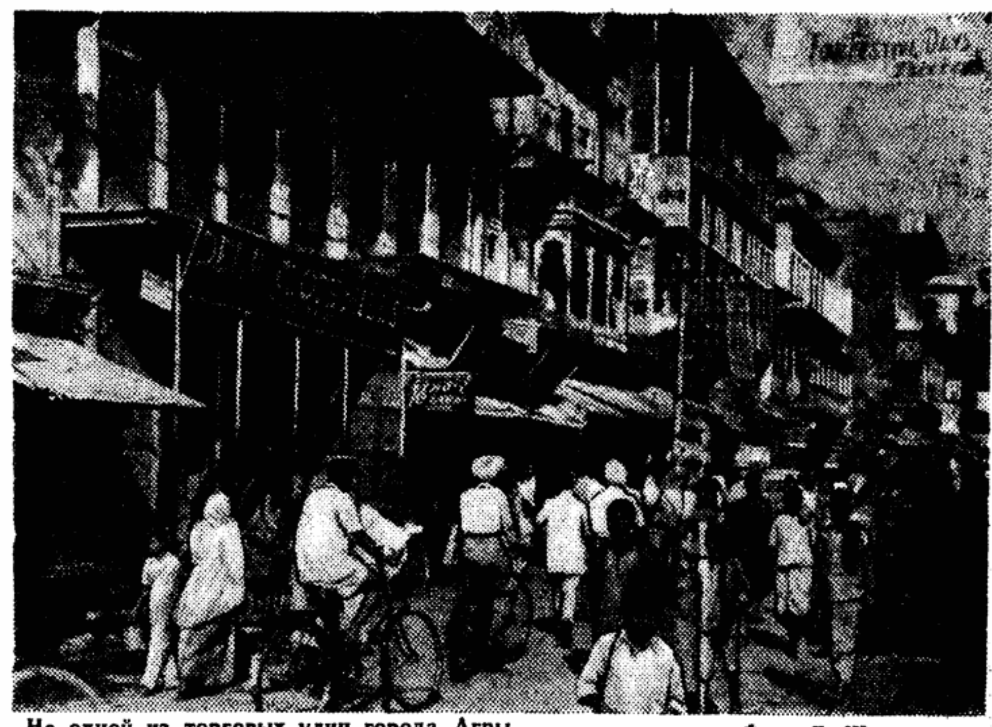
На одной из торговых улиц города Агры